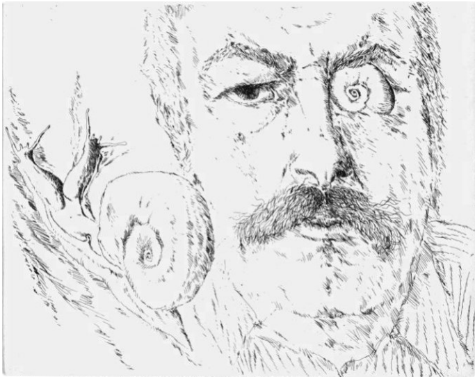
Günter Grass, Selbstportrait 1972

Die Stiftung Hugo J. Tauscher im Zwiegespräch mit Peter Zeiler