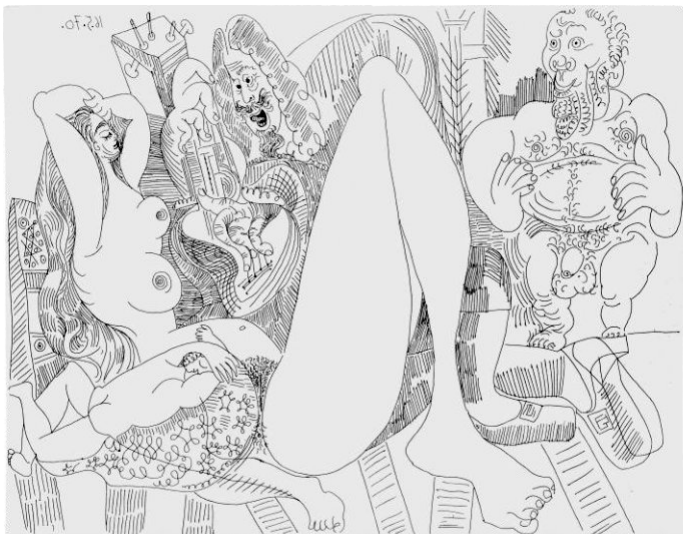
Pablo Picasso, Liegender Akt 1970